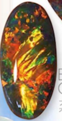
Black Opal ブラックオパール