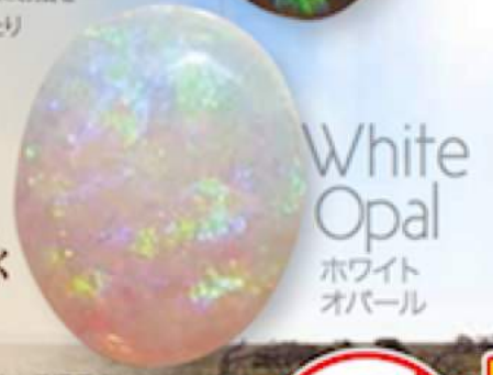
White Opal ホワイトオパール

「気温50℃。飛んでいる鳥が途中で気絶して落ちてくる暑さの中、オパールは採掘されます。」 「ライトニングリッジの半径15kmくらいの中の、地図上で点を打ったほどの場所です。」