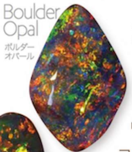
Boulder Opal ボルダーオパール

質、数、種類ともに、西日本に類を見ない規模の「大オパール展」をミムラ天満屋で開催します。